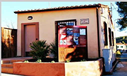
El CIUDEB a El Pago, Subirats

El CIUDEB és un equipament museogràfic singular i de referència relacionat amb la Guerra Civil que s'emplaça a Subirats, al poble de El Pago. El projecte del Centre ha estat elaborat pel Centre d'Estudis de Subirats (CESUB) i la seva realització ha estat possible gràcies a la participació de l'Ajuntament de Subirats.